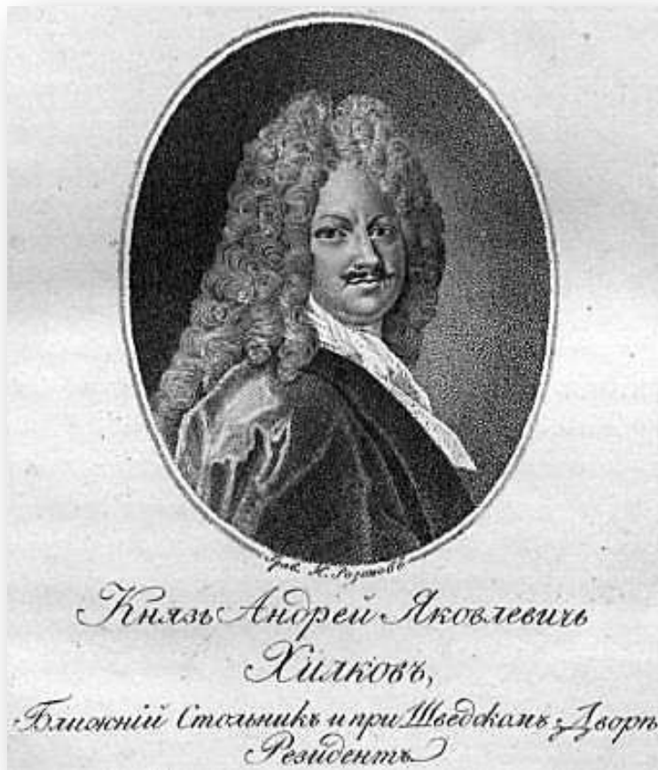
Хилков Андрей Яковлевич (1676–1716)

Хилков Андрей Яковлевич – резидент (представитель) Петра I при дворе Карла XII в Стокгольме.