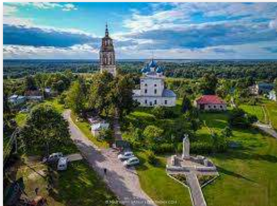
город Стародуб (1080– )

Далее К.Ф. Миллер представил краткую родословную Хилковых со времени царствования Иоанна Васильевича в XVI веке от предков под именем Ряполовские, происходивших от князей Стародубских (от князя Ивана Всеволодовича, меньшего сына Великого князя Всеволода Юрьевича, который в 1233 году получил в удел город Стародуб (в Брянской области России) от своего брата Великого князя Ярослава Всеволодовича).