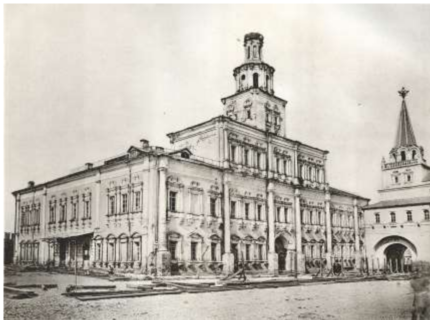
Древнее здание, в котором в 1755 г. был открыт Московский университет

Книга «Ядро российской истории» печаталась в типографии Клаудия Христофора Александровича, который по сведениям А.Ю. Самарина вошел в российскую историю «как владелец «вольной» «Типографии при Театре» (1783–1795) и арендатор (совместно с Х. Ридигером) типографии Московского университета (1794–1800)» ( https://www.makushin.me/past/07/44-47 ).