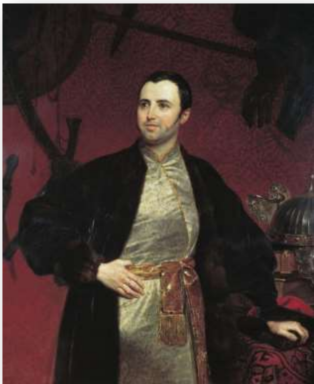
Портрет М.А. Оболенского. Художник Карл Павлович Брюллов

Оболенский Михаил Андреевич (1805—1873) , князь, русский историк-архивист и археограф.